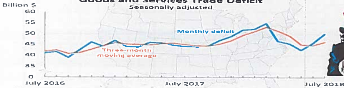
Goods and Services Trade Deficit Seasonally adjusted